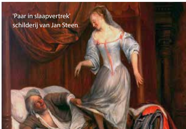
'Paar in slaapvertrek' schilderij van Jan Steen

Naar dit oude spreekwoord werd de afgelopen eeuwen in Nederland veel verwezen. Het betekent kort gezegd: als twee personen van een verschillend geloof met elkaar trouwen, kán het haast niet goed gaan. Vaak werd dit spreekwoord gebruikt in de context van een huwelijk tussen een katholiek en protestant.